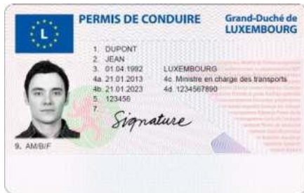
Permis de conduire